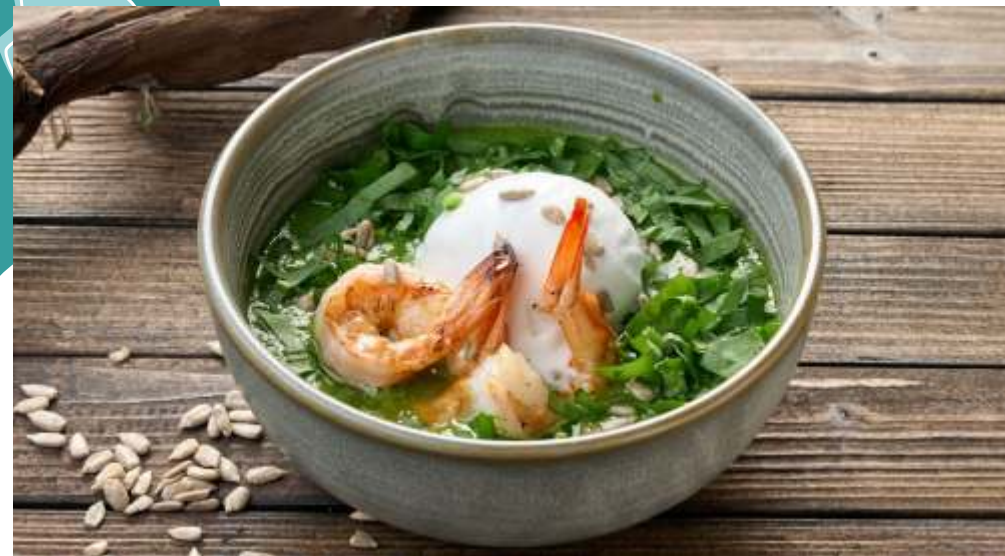
ЩАВЕЛЕВЫЙ ГАСПАЧО С КРЕВЕТКАМИ И КОКОСОВЫМ СОРБЕТОМ 西班牙凉菜汤配虾和椰子雪糕 470.- 1245克