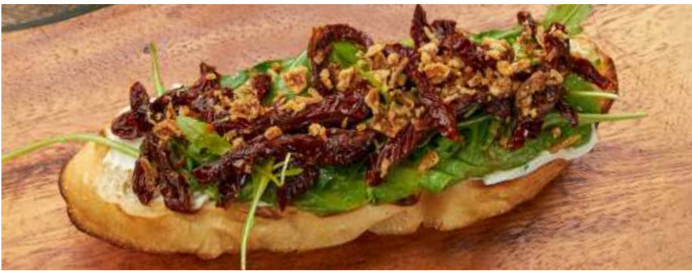
NEW БРУСКЕТТА С АВОКАДО И ВЯЛЕНЫМИ ТОМАТАМИ 意式烤面包配牛油果和晒干的西红柿