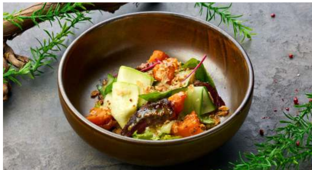
САЛАТ С ГРЕБЕШКАМИ И СТРАЧАТЕЛЛОЙ