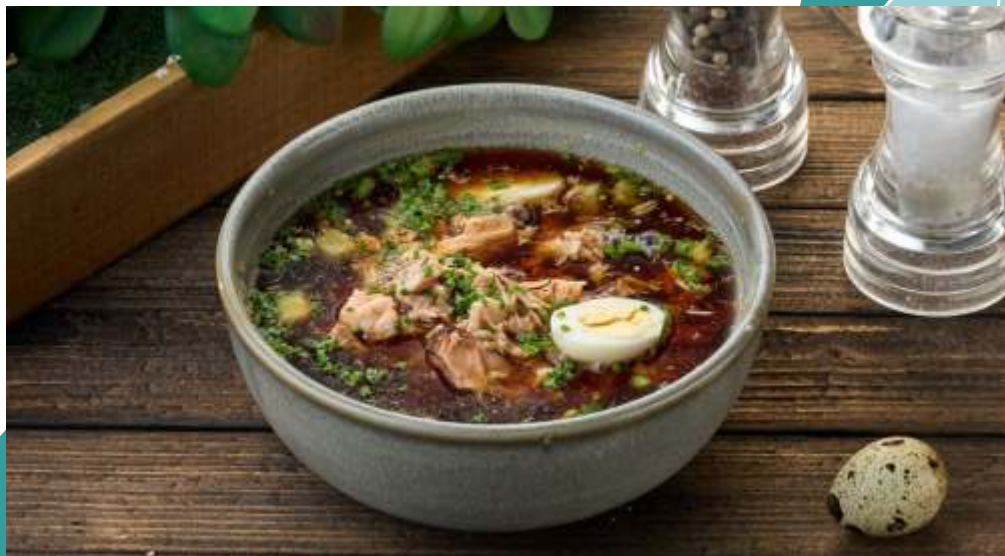
ОКРОШКА С ПОДКОПЧЕННЫМ ЛОСОСЕМ 冷杂拌汤配烟熏三文鱼 390.- 1180/250克