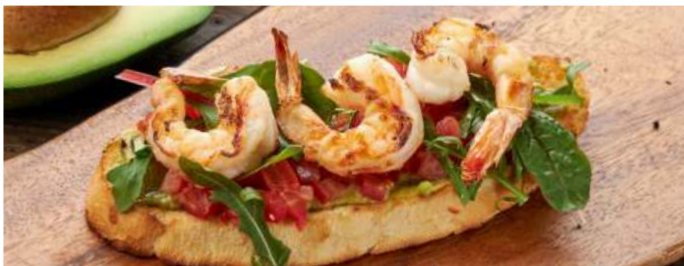
С КРЕВЕТКАМИ И ГУАКАМОЛЕ