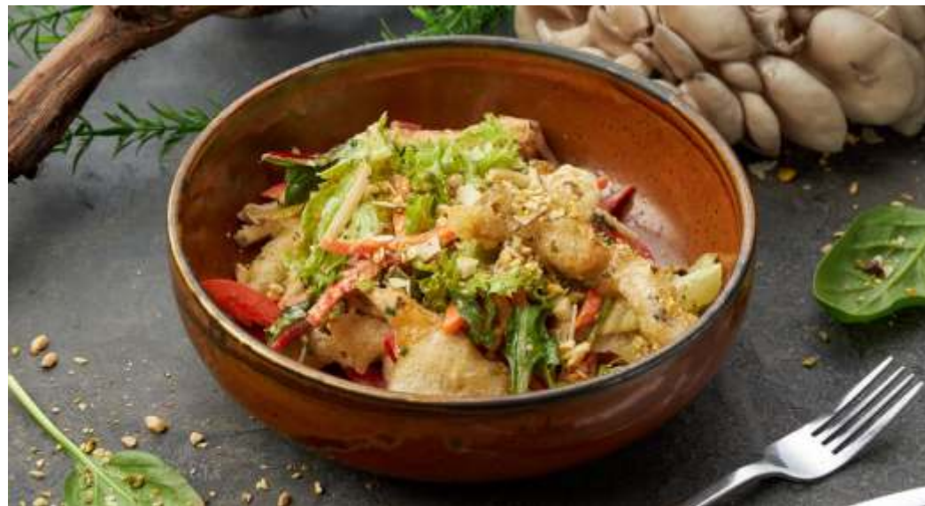
АЗИАТСКИЙ САЛАТ С ВЕШЕНКАМИ ТЕМПУРА