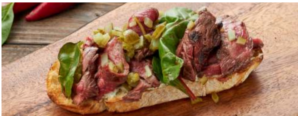
СО СТЕЙКОМ АЙРОН